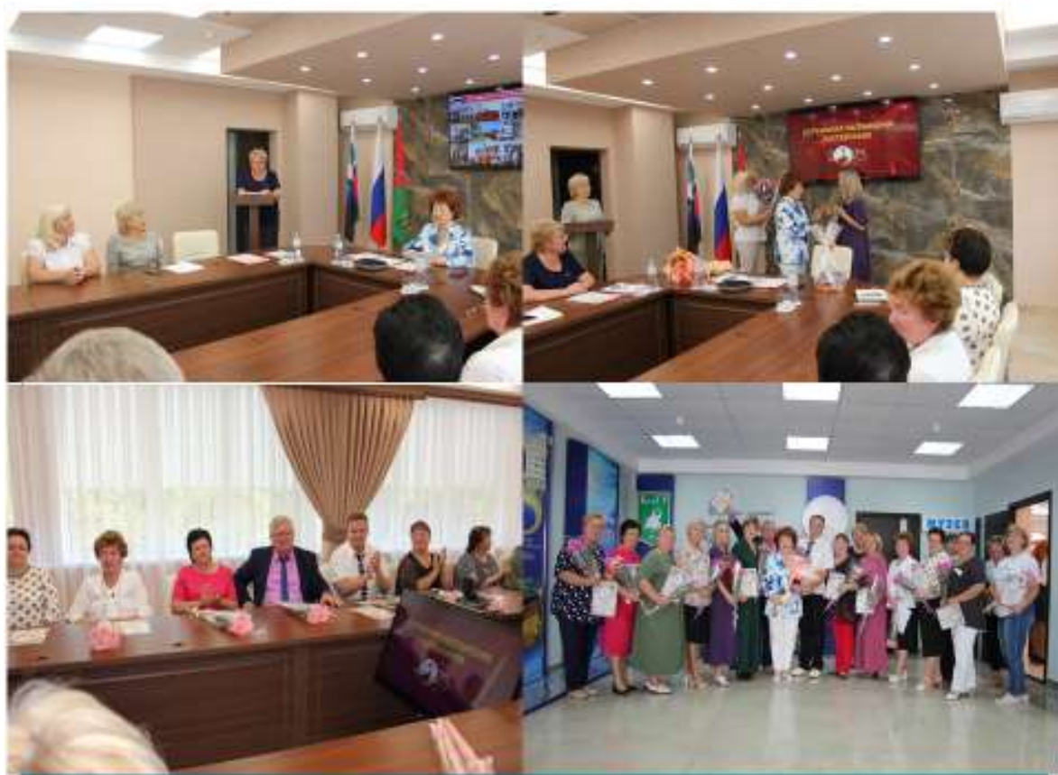
Торжественное заседание, посвященное Году педагога и наставника

- реализуя методическую тему ОГАПОУ СПК, в 2023 г. (98%) педагогов колледжа опубликовали статьи в разноуровневых сборниках научно – практических конференций, (70 %) педагога приняли очное участие в деловых программах, пленарных заседаниях региональных стажировках.